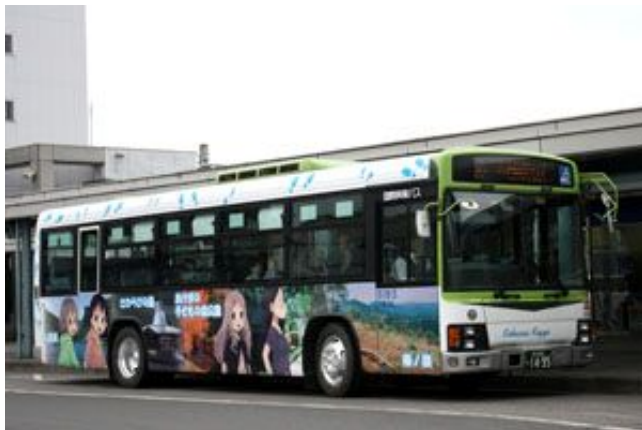
市内の観光名所をラッピング（2号車）