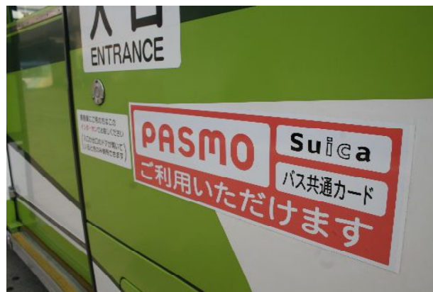
▲ICカードが利用可能な車両に掲出されるステッカー

国際興業株式会社(本社:東京都中央区 社長:小佐野隆正)では、新たに6月28日(木)から、さいたま営業所のバス125台でICカードの取扱いを開始し、「PASMO」と「Suica」のご利用可能エリアを拡大します。