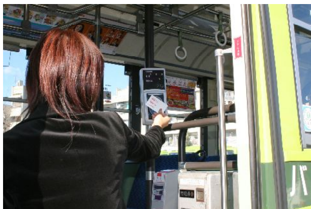
▲ICカードでの乗車風景