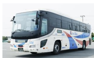
運行車両例（京成バス）