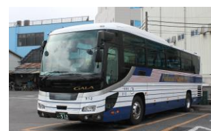
運行車両例（国際興業バス）