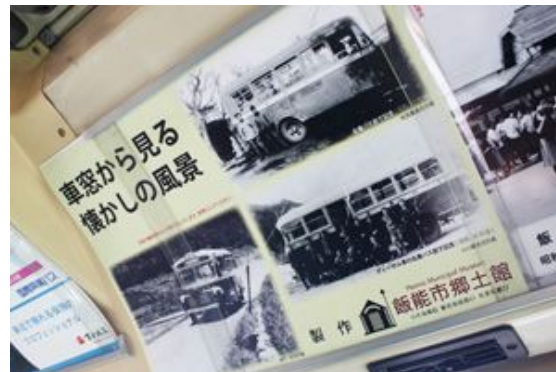
車内には懐かしいバス沿線風景を展示

国際興業グループ株式会社(本社:東京都中央区八重洲 2-10-3、社長:南正人)は、飯能営業所管内で旧塗装復刻バスの運行を12月7日より開始しました。