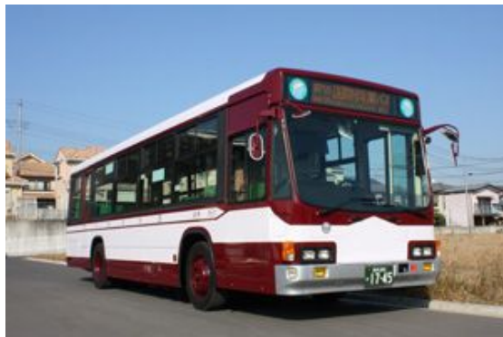
1950年～1959年頃迄使用したデザインを復刻