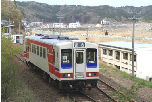
三陸鉄道 復興支援列車に乗車