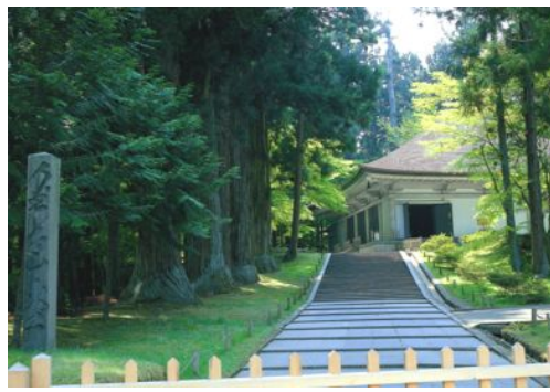
世界遺産正式登録！中尊寺金色堂へ