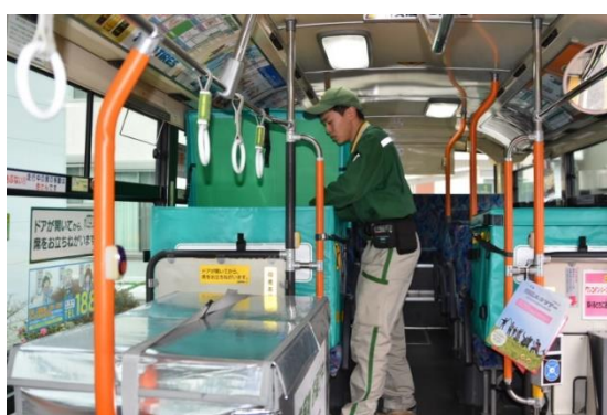
宅急便を積み込む様子 (手前がクール宅急便、奥が常温の宅急便)