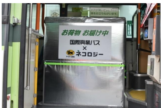
オリジナルクールボックス (縦600mm×横1100mm×高さ1200mm)